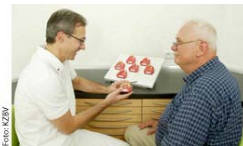
Im vertrauten Gespräch - hier "ganz unter Männern" - kann der Zahnarzt gemeinsam mit dem Patienten eine Therapieentscheidung treffen.

Wie die Alterspyramiden der meisten Industrienationen wird sich auch die deutsche in den nächsten Jahrzehnten erheblich verschieben und sich eher als Altersspitz in der Zukunft präsentieren. Aktuelle Berechnungen besagen, dass sich die deutsche Bevölkerung mit einer 80-prozentigen Wahrscheinlichkeit verringern wird. Die Geburtenzahlen bleiben rückläufig und die Zahl der Todesfälle wird trotz steigender Lebenserwartung zunehmen.