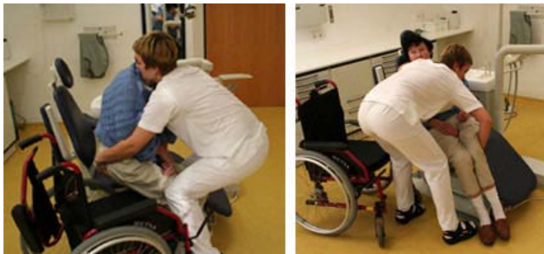
Das Umsetzen vom Rollstuhl in den Behandlungsstuhl will geübt sein, damit das Rückgrat des Zahnarztes nicht leidet.

■ Der Praxisinhaber sollte ebenfalls für sich entscheiden, ob er Senioren lediglich in der Praxis behandeln kann oder ob er auch mobil seine zahnärztliche Leistung anbieten möchte. Dementsprechend muss er sich ausrüsten. In einigen Bundesländern (wie unter anderen Hessen) stehen mobile Behandlungseinheiten zur Verfügung.